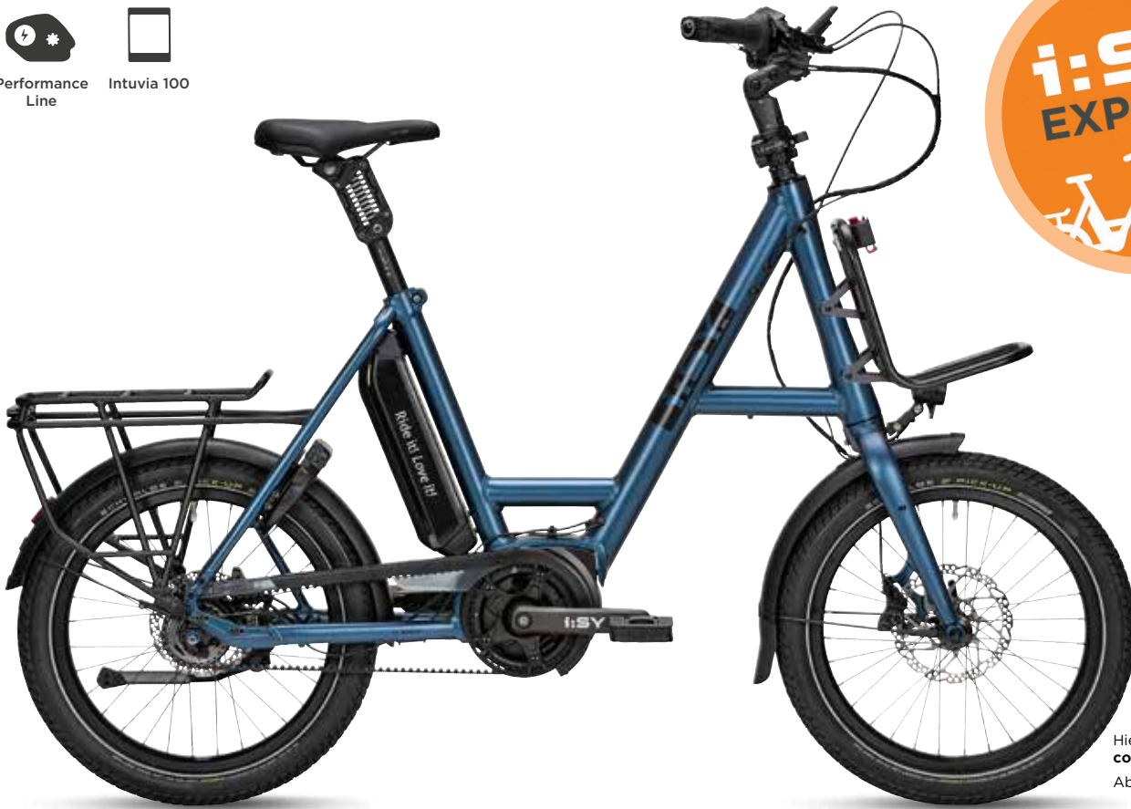
Hier abgebildet: cosmos blue matt Abbildung ähnlich