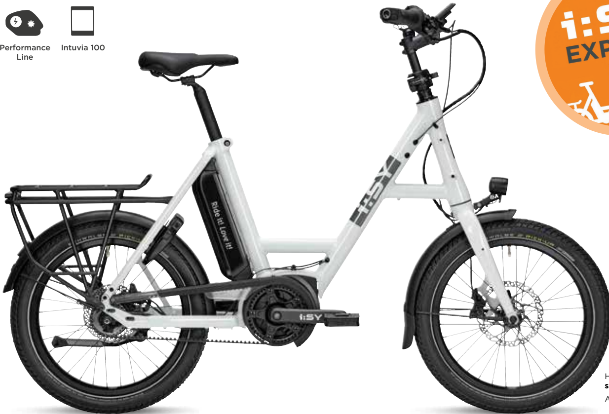
Hier abgebildet: seashell white glanz Abbildung ähnlich